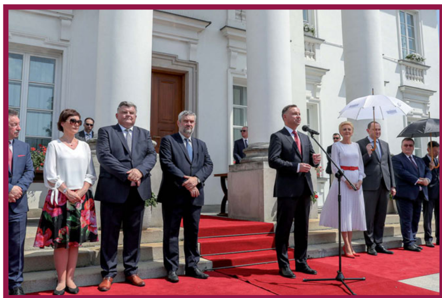
Uroczysta Gala AgroLigi 2018 w Belwederze

W konkursie AgroLiga, który jest prowadzony od 1993 roku, udział wzięło już blisko osiem tysięcy rolników i agrofirm. Od 2008 roku Honorowy Patronat na Galą AgroLigi sprawuje Prezydent RP.